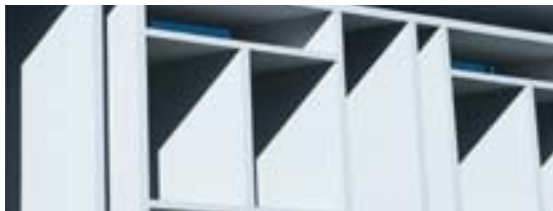
Pagina 10 | Muurverven en reparatiemiddelen voor op beton