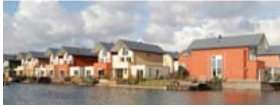
Pagina 4 | Dispersiemuurverven