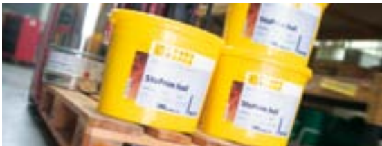
Pagina 9 | Gronderingen