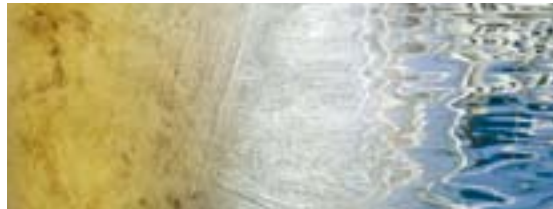
Pagina 8 | Speciale muurverven