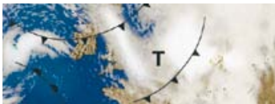
Pagina 12 | QS technologie