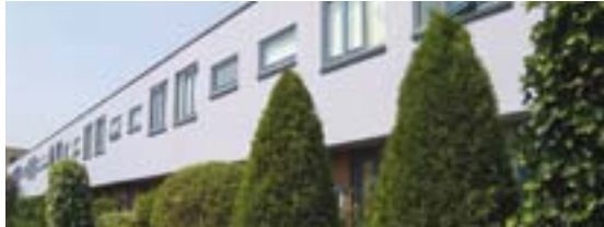
Pagina 6 | Siliconenmuurverven